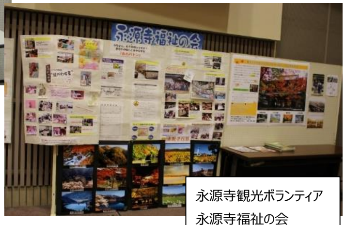
永源寺観光ボランティア 永源寺福祉の会