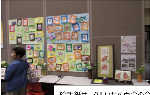
絵手紙サークルいなべ百合の会