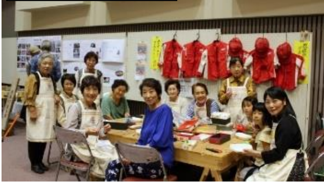
日赤いなべ地域奉仕団