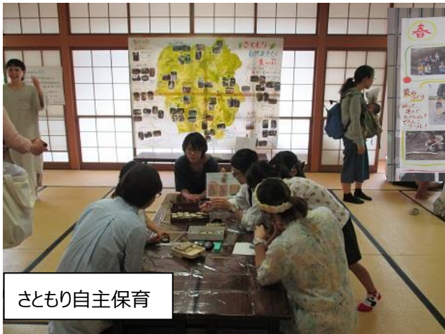
さともし自主保育