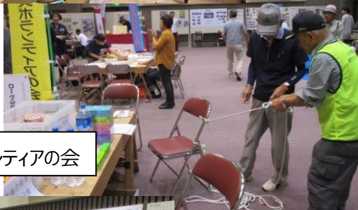
いなべ防災ボランティアの会