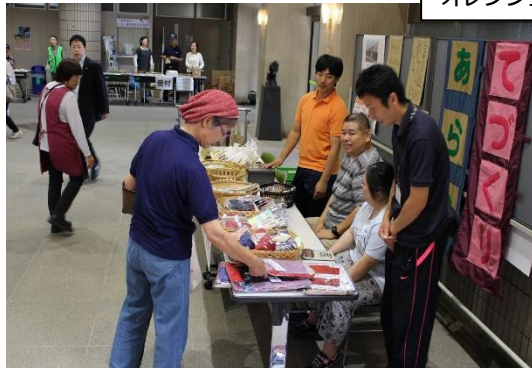
オレンジ工房あげき