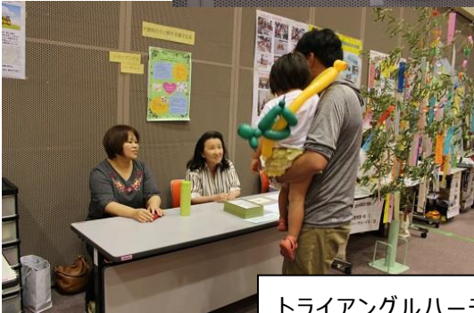
トライアングルハーティー