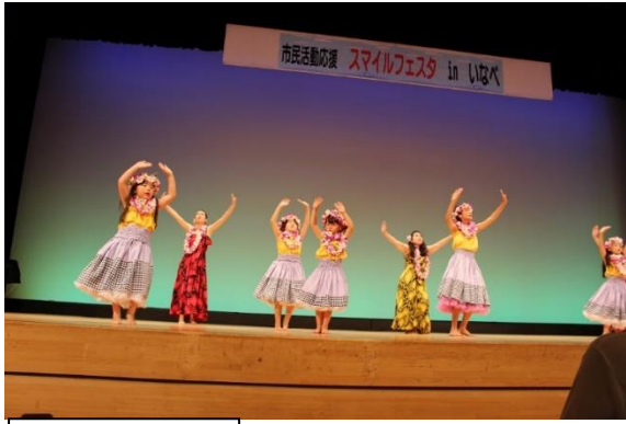
ラニフラスタジオ