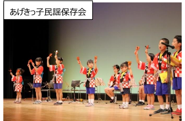
あげきっ子民謡保存会