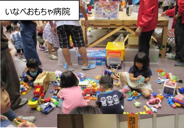
いなべおもちゃ病院