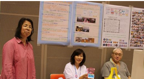
みえきた市民活動センター