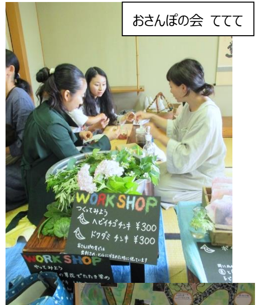
おさんぽの会 ててて