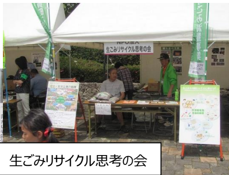
生ごみリサイクル思考の会