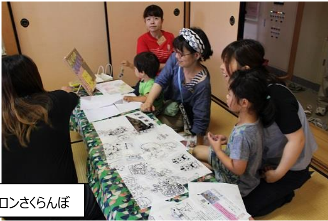
子育てサロンさくらんぼ