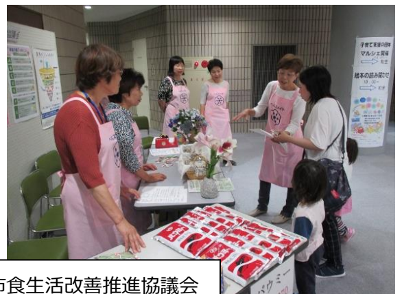
いなべ市食生活改善推進協議会