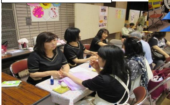
「なごみ」によるハンドマッサージ