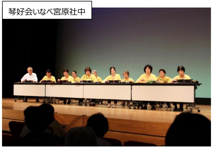
琴好会いなべ宮原社中