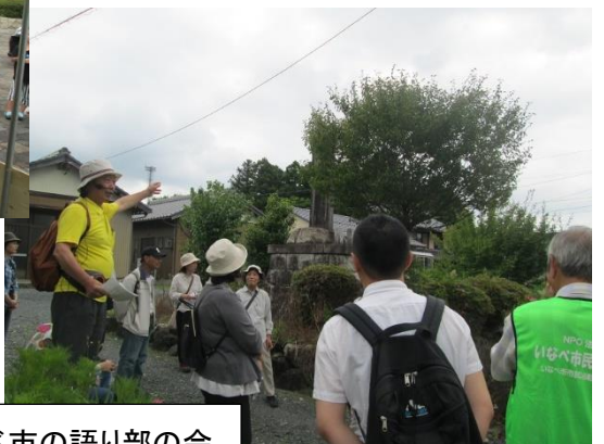
ふるさといなべ市の語り部の会