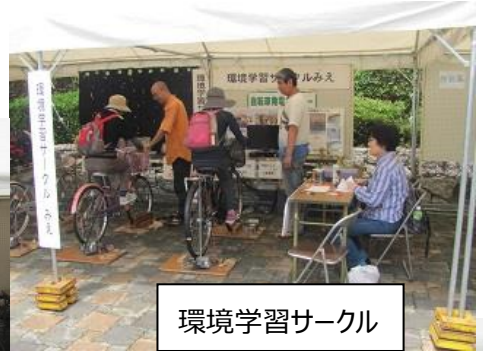
環境学習サークル