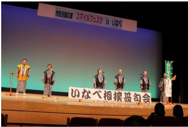
いなべ相撲甚句会