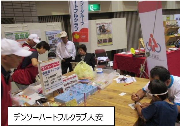
デンソーハートフルクラブ大安