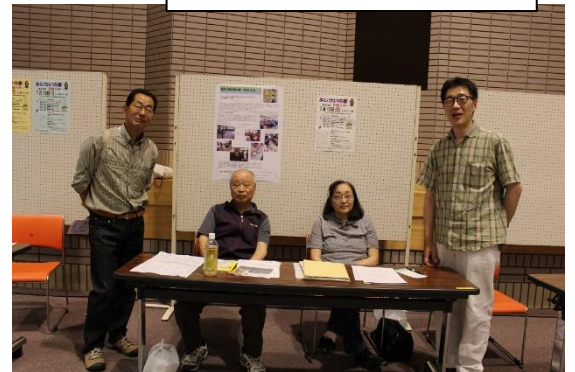
障がい者支援の輪 ののはな