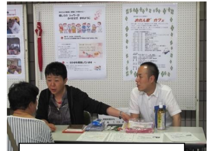
認知症ボランティア かのん

ロビーにおいていなべ市の人口動向や高齢化率を記載したポスターを掲示し、来場者にこれから迎える現実をお知らせしました。