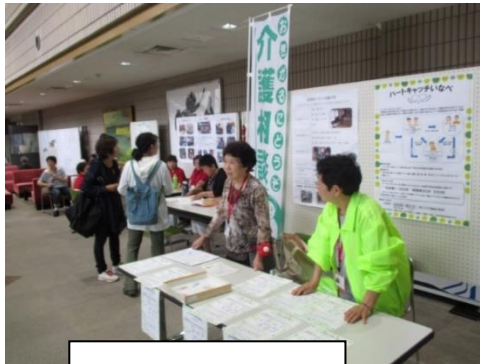
ハートキャッチいなべ