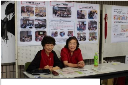
南金井地域サロン宮美会