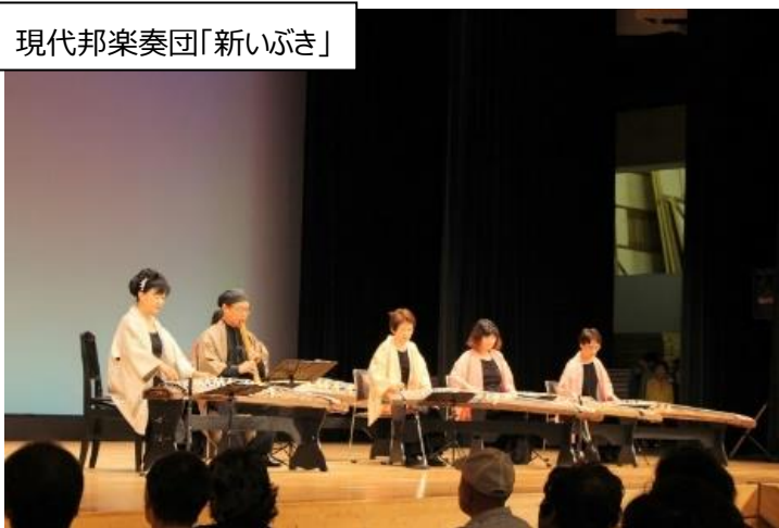
現代邦楽奏団「新いぶき」