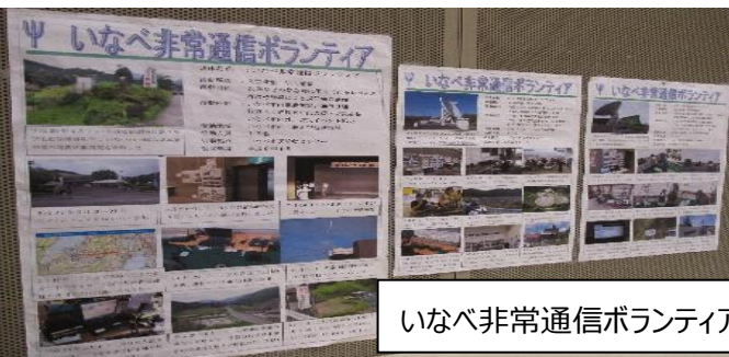
いなべ非常通信ボランティア