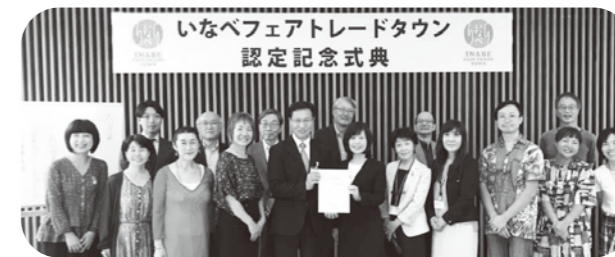
フェアトレードタウン認定記念式典の様子

いなべ市は市民活動団体「いなべフェアトレードタウン」の働きなどが認められ、2019年に日本で6番目のフェアトレードタウンに認定されました。