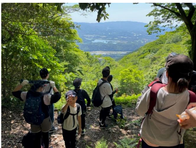
第3見晴らしポイントにて