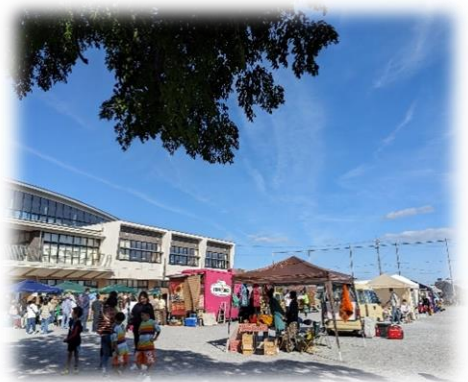
昨年の笠間の里マルシェ&フェスタの様子

有志が集まった笠間の里せんだんネットワークが毎年開催するイベントです。毎年大人気のお化け屋敷をはじめ、演歌や津軽三味線のショー、子どもたちによるヒップホップダンスのステージもあります。また、さまざまな店舗が一堂に会するマルシェや、ラリーカーの展示など盛りだくさんの内容で、皆さんをお待ちしています。雨天決行。